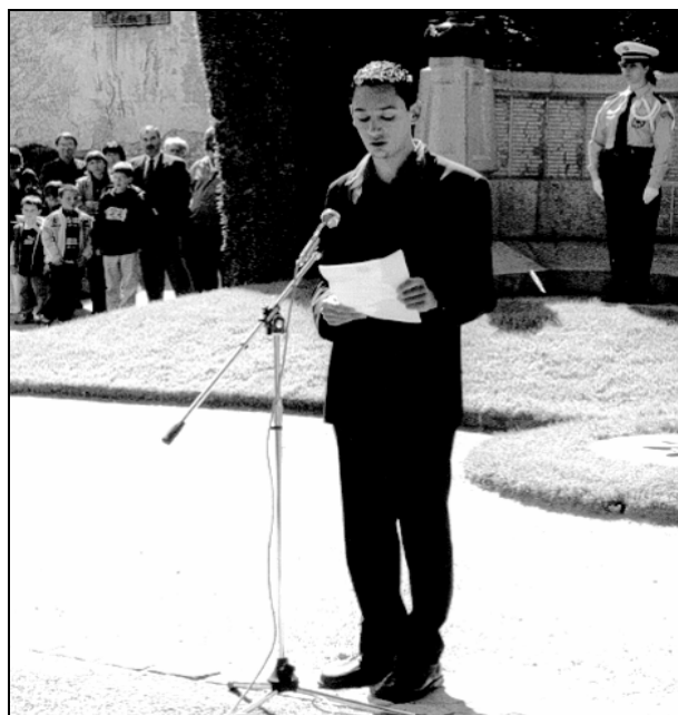
Lecture du message de Gaulle à la Nation par lauréat du Concours de la Résistance et de la déportation 2004

A Guéret, en présence du Préfet et des personnalités civiles et militaires, recueillement successif au Carré militaire du cimetière, au Mémorial de la Résistance et au Monument aux morts de la ville. Allocutions traditionnelles : message de l'UFAC, lu par le Pdt départemental ; message du général De Lattre à la 1 ère armée française, lu par le Pdt départemental de Rhin et Danube ; message à la Nation du général De Gaulle, lu par un lauréat du Concours de la Résistance et de la Déportation 2004 : message du Ministre des Anciens Combattants lu par le Préfet. Présence, à souligner, d'écoliers et de militaires.